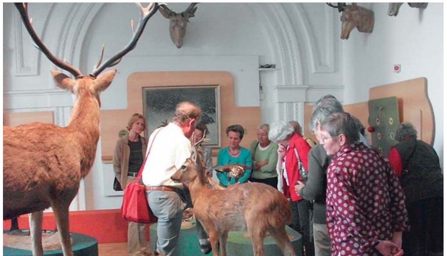
Zu Besuch im Jagdmuseum in der Münchener Fußgängerzone