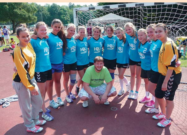
Die weibliche B-Jugend