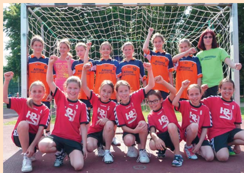
Die weibliche D- und gem. E-Jugend