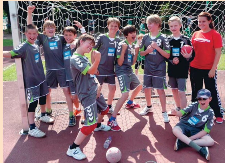
Die männliche D-Jugend