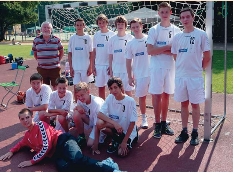
Die männliche B-Jugend