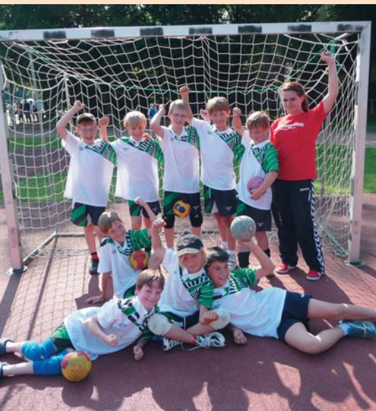
Die männliche E-Jugend

Und ewig grüßt das Murmeltier – es kommt einem so vor, als hätte man erst vor wenigen Tagen mit den Planungen für den Handballtag begonnen, und schon ist das Wochenende mit 70 Mannschaften, rund 700 Handballspielern und mindestens genauso vielen Besuchern, vielen Toren, zum Glück wenigen Verletzungen und vor allem zwei Tagen durchgehenden Sonnenschein bereits wieder vorbei.