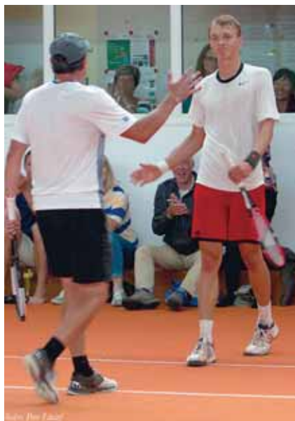
Finalisten Herren beim Hand-Shake