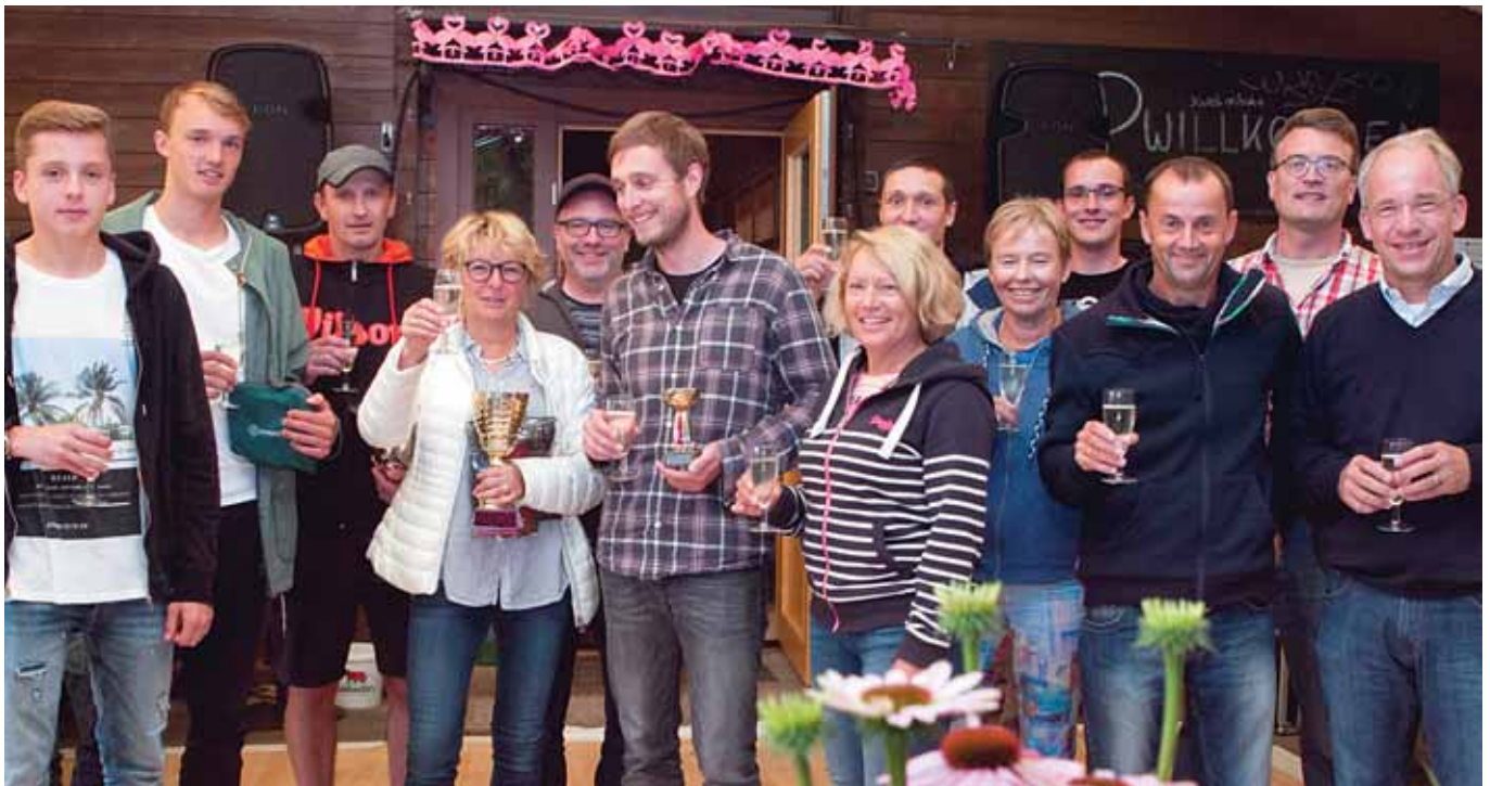
Alle Sieger und Platzierten Erwachsene