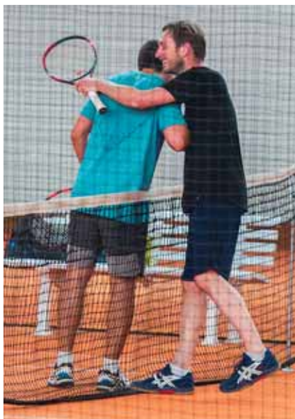
Finalisten Breitenport beim Shake-Hands