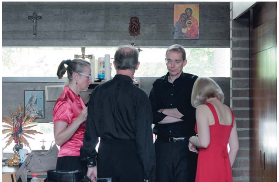
Umkleide in der Sakristei

In fast zwei Stunden suchten wir uns die Musik aus, legten die Raumaufteilung für den Paso fest, übten die Choreographie, entschieden uns für ein