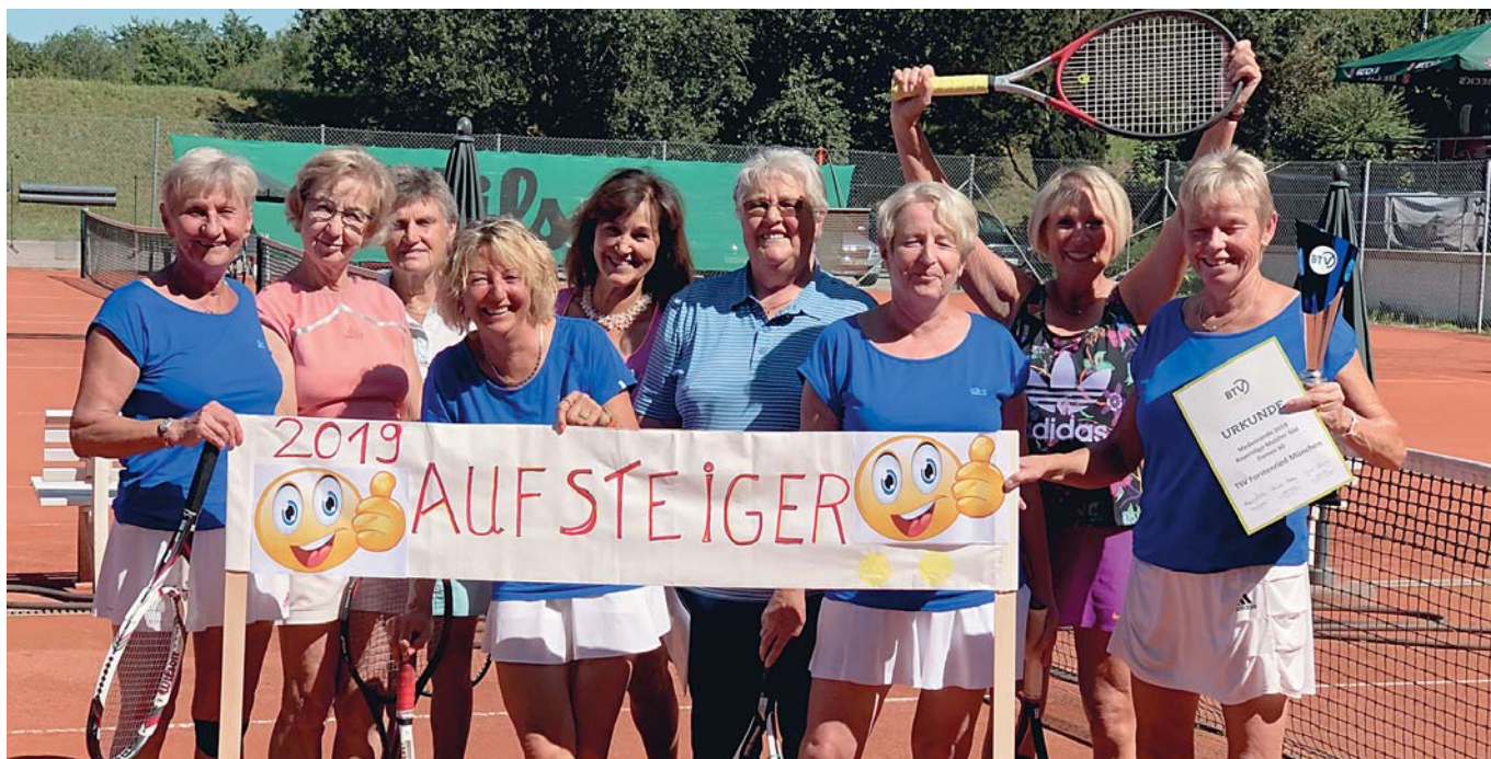
Die Tennis-Damen60 mit ihren spontanen Einspringern der Damen65 sowie der Vertreterin des BTV (4.v.r.)

Als Damen 40 stieg diese Mannschaft erstmals in die Bayernliga auf. Von 2005 - 2007 spielten sie jedoch wieder Landesliga.