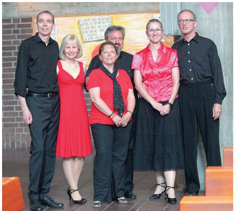
Die drei Tanzpaare

so-Doble haben sie sich vor einiger Zeit erst per Handyvideo angeeignet, da sie beim Einstudieren dieser Choreographie noch nicht bei uns im Verein waren. Donnerstags in der Leistungsgruppe Latein wird diese regelmäßig ge-