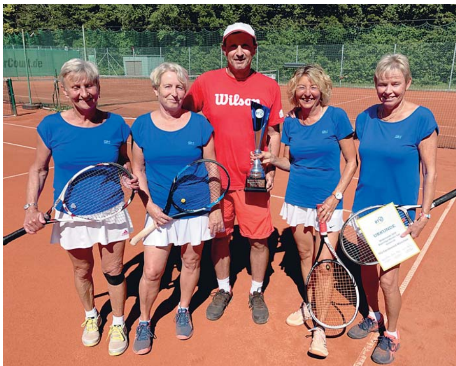
Trainer Mike gratulierte dem erfolgreichen Team