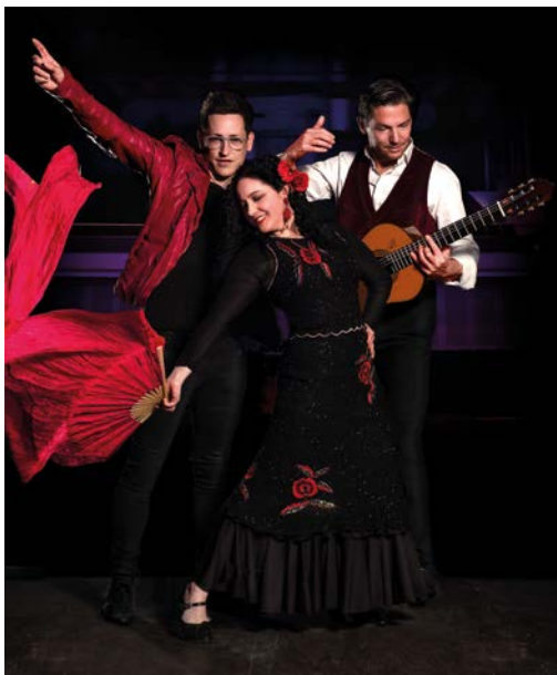
Café del Mundo, Sa., 17. Juni, 19.30 Uhr Zirkuszelt, Foto: Alec Sander

Mit Parlura, Manuel André, Quirinello, Azure Estuary Durchgeführt von: Jugendzentrum Treibhaus, www.treibhausmuenchen.de