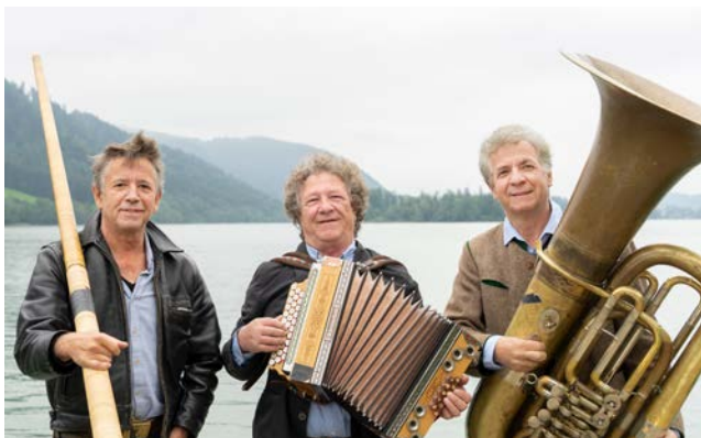
Well-Brüder, Mo., 19. Juni, 19.30 Uhr Zirkuszelt, Foto: Hans-Peter Hösl