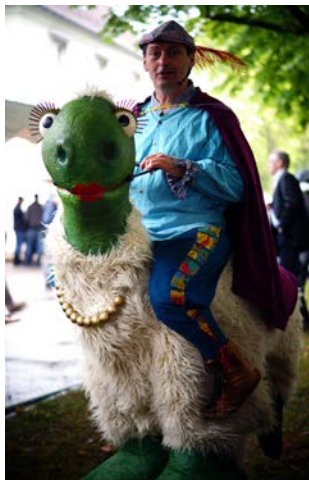
„Drako“ und „Madame de Pompadour“, Buchfink Theater