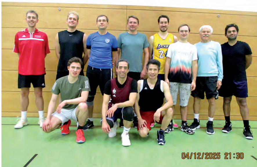
Auf dem Bild vom 4. Dezember 2025 (oben) zeigen elf Spieler der Männer 4 ihr freundlichstes Lächeln. Auf dem Bild vom 29. Januar 2026 (unten) grüßen 18 Männer (inkl. Fotograf) einen verletzten Kollegen und Mitspieler.