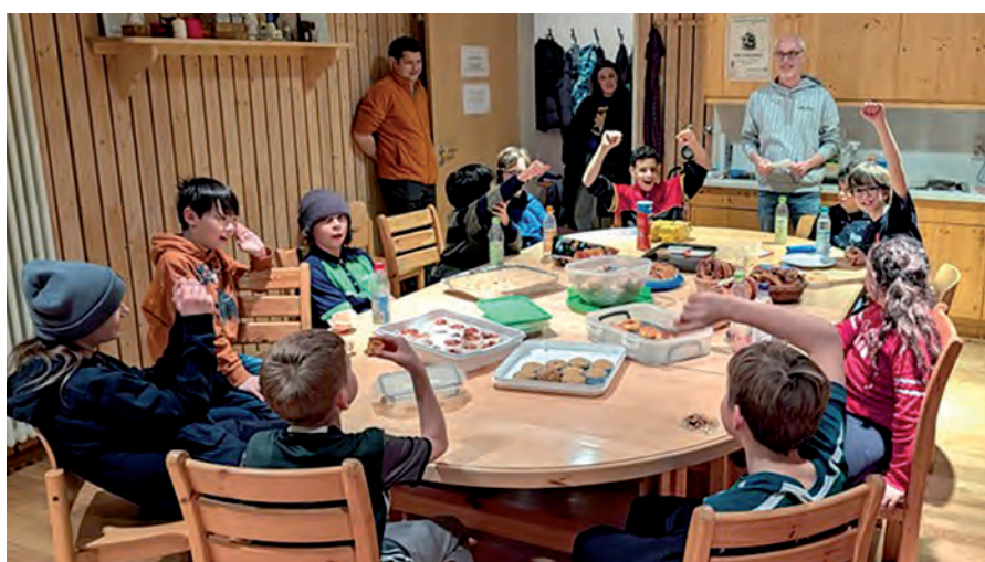
Begrüßung der ersten, „jüngeren“ Gruppe

„Neujahrs“-Kegeln der TT-Jugend Da aus Termingründen im Dezember keine Weihnachtsfeier für die