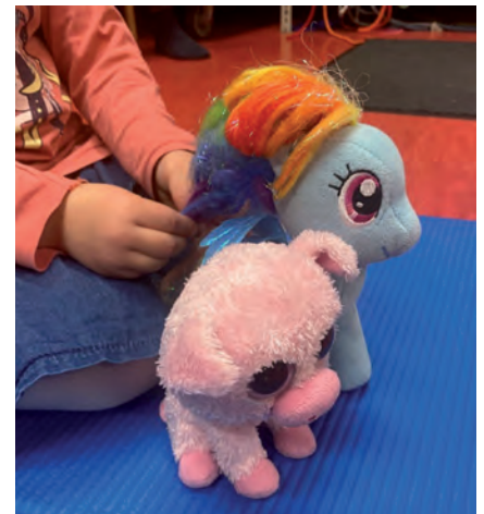
Sogar Kuscheltiere wollten unbedingt zuschauen!

Wir freuen uns schon auf ein tänzerisches 2026