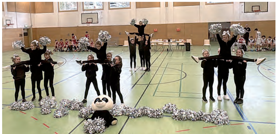
Starke Performance der Cheerleader in der Halbzeitpause

sie ein Spalier, bevor sie in der Halbzeitpause ihren großen Moment hatten. Zu Let's Get Loud von Jennifer Lopez zeigten sie eine energiegeladene Performance, die von Eltern und Zuschauern mit viel Applaus und sogar Standing Ovationen gefeiert wurde.