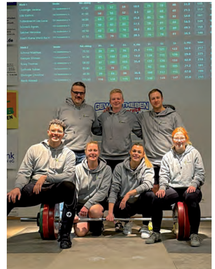
Mannschaft gegen TSV Waldkirchen

Am 10.01.2026 stand der Auswärtskampf gegen den Absteiger aus der 2. Bundesliga, den TSV Waldkirchen,