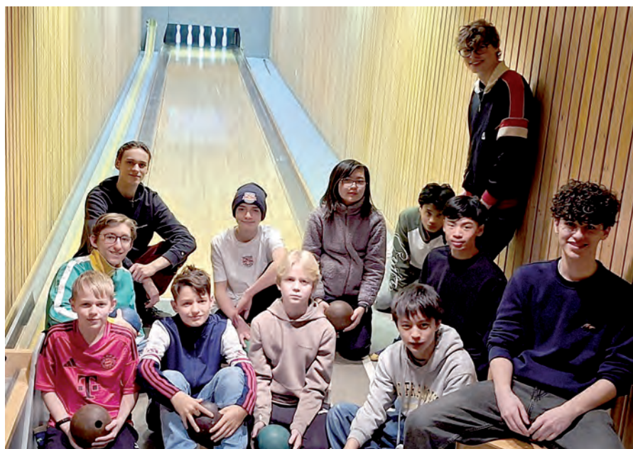
Die „ältere“ Gruppe 2 nach den Kegelspielen auf der Bahn

Jugend stattfand, hatten wir für Anfang Januar zu einem „Kegel“-Event im Pfarrheim St. Joachim