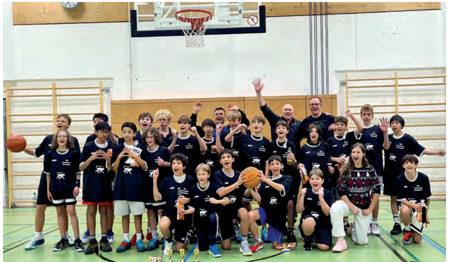
U14 beim Weihnachtsevent in den neuen Shooting Shirts von MONKEYWAY

Die Rückrunde startete für beide Teams erfolgreich – und gleich folgte das nächste Highlight. Beim Heimspiel der U14-2 gegen Fürstentfeldbruck feierten die Cheerleader des TSV Forstenried ihren ersten offiziellen Auftritt. Bereits beim Einlauf der Spieler bildeten