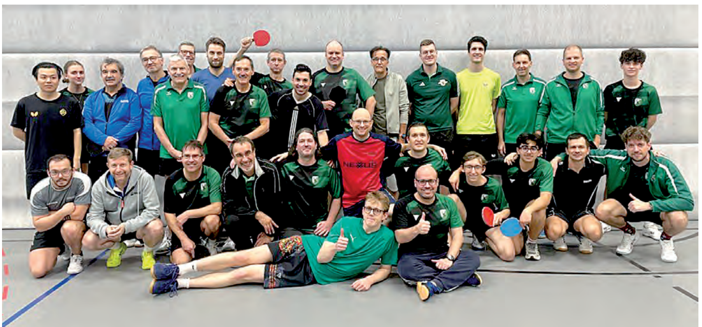
Die Teilnehmer der harmonischen Weihnachtsmeisterschaft unserer Tischtennisabteilung