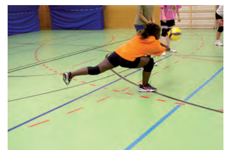
Weitere Bilder von der Weihnachtsfeier am Netz auf der nächsten Seite