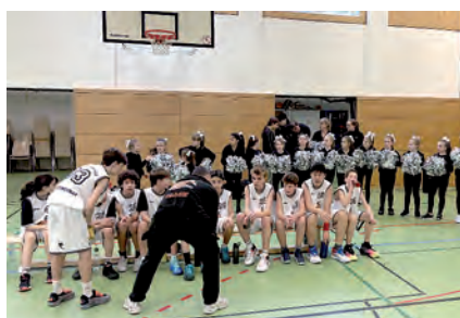
Tatkräftige Unterstützung der U14-2

sie ein Spalier, bevor sie in der Halbzeitpause ihren großen Moment hatten. Zu Let's Get Loud von Jennifer Lopez zeigten sie eine energiegeladene Performance, die von Eltern und Zuschauern mit viel Applaus und sogar Standing Ovationen gefeiert wurde.