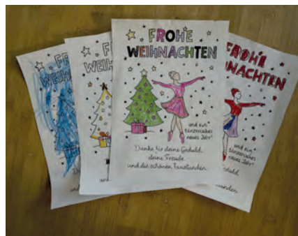
So schöne selbstgemalte Bilder!

Mit Süßigkeiten für die Tänzerinnen und selbstgemalten Kunstwerken für die Trainerin endete das Tanzjahr 2025.