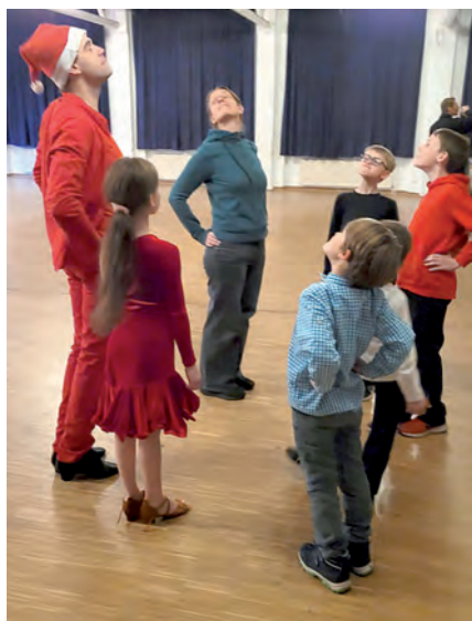
Paso-Doble mit Kindern

Tanzfläche blieb längere Zeit fast leer. Unsere Mitglieder hatten offensichtlich an diesem Abend mehr das Bedürfnis zu quatschen als zu tanzen. Das Restaurant „Gushu“ war zu dieser Zeit eigentlich geschlossen, weil es renoviert wurde. Doch die Wirtin hat extra für uns die Küche aufgemacht und uns neben Getränken einige wenige Gerichte angeboten.