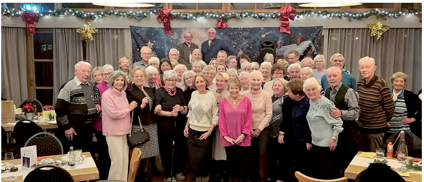
Wandergruppe 60+ mit allen Gästen am 17. Dezember 2025

Die Gemeinsamkeit der Wandergruppe 60+ wurde bei der Weihnachtsfeier 2025 von den Jüngeren, Älteren und Ehemaligen vielleicht deshalb so besonders festlich begangen, weil sie in eine Zeit von weltweiten Kriegen, Krisen und Ungewissheiten fiel. Der gegenseitige Halt in der Gruppe der Wanderer wurde allen Anwesenden sehr bewusst. Sie gedachten natürlich auch all derer, die im vergangenen Jahr zu ihrer letzten Rast aufgebrochen waren.