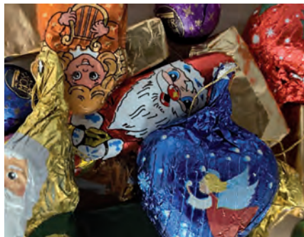
So viel Engagement muss belohnt werden