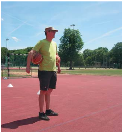
Ebse passt auf