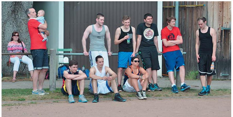
Jede Mannschaft durfte auch mal zuschauen