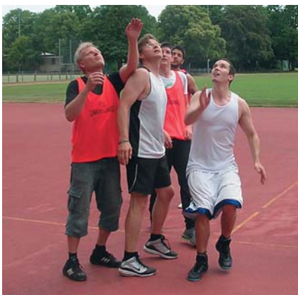
Unter dem Korb