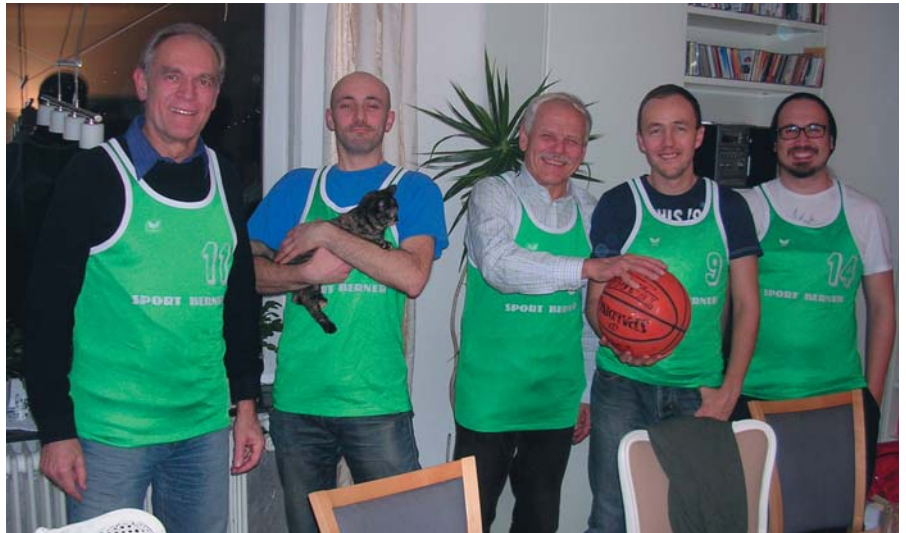
Junge Männer in alten Trikots

Das Planungsteam hatte im Rahmen des Sommerfests zur Teilnahme an einem Turnier eingeladen. Jeder, der wollte, durfte mitmachen und seinen Namen auf einen Zettel schreiben und in einen der entsprechenden Töpfe (Herren, Damen, U18/U16, U14/U12, Gäste) einwerfen. Knapp 30 Personen nahmen teil und es wurden 5 gemischte Mannschaften ausgelost. Die Bulls, Blazers, Spurs, Celtics und Mavs trugen dann ein kleines Turnier aus. Jede Mannschaft musste viermal für 10 Minuten antre-