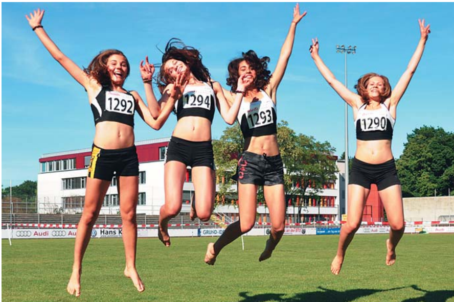
Die Mädels freuen sich in Ingolstadt