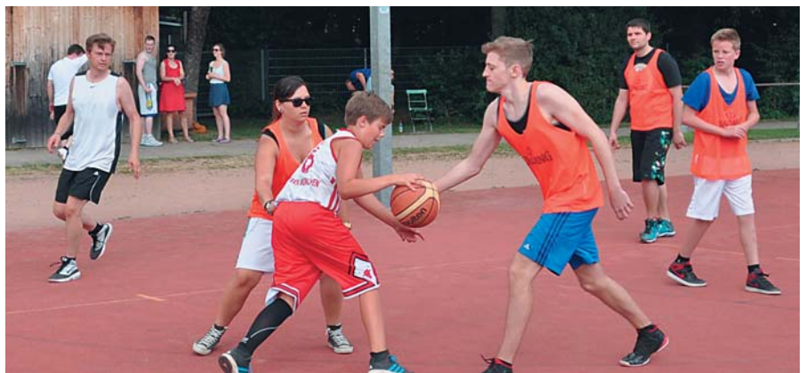
Kampf um den Ball