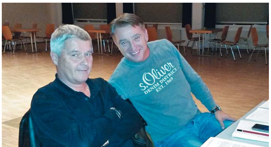
Auch bei der 10. Probe noch (?) gut gelaunte Regisseure ...