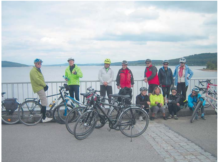
Regenwetter auf der Fahrt nach Ruffenhofen