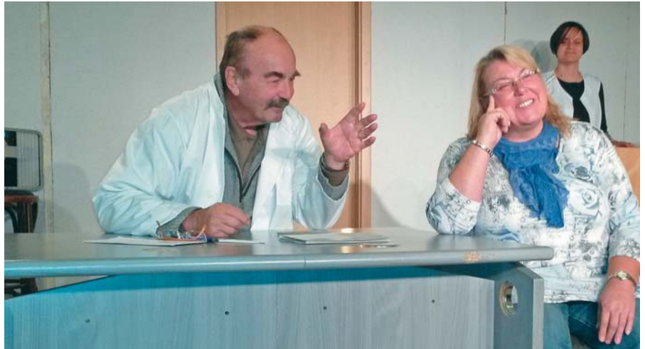
Dr. Bacchus und Frau Öfter (Probenfoto)