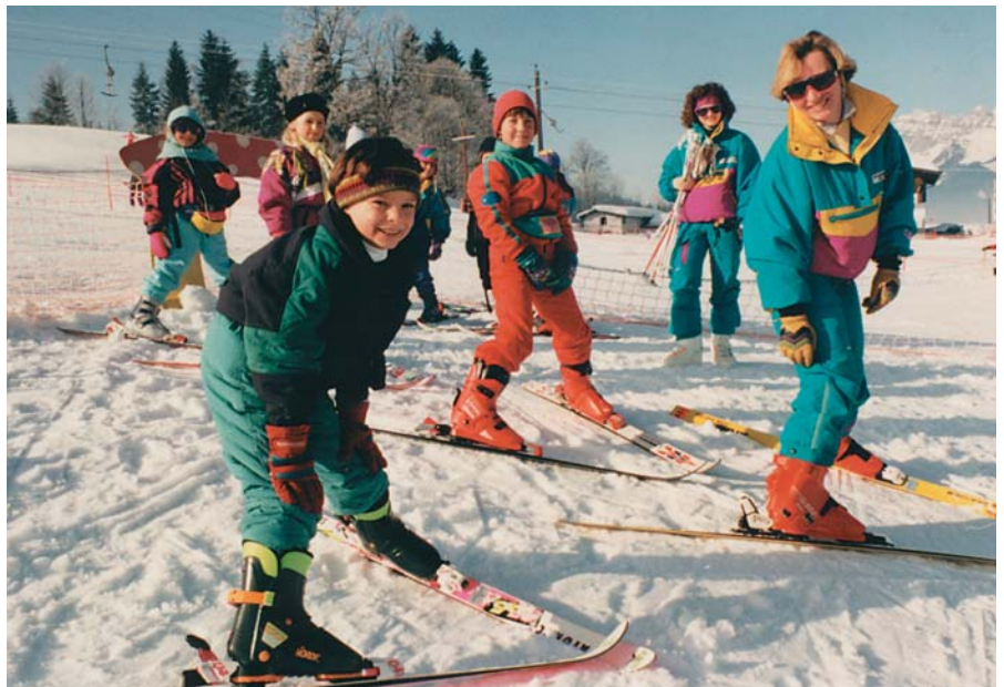
Skikurs Anfang der 1990er Jahre...

In den Neunzigern gab es aber auch Jahre, in denen wir mit bis zu 5 Bussen in die Skigebiete aufgebrochen sind. In der »Sommerpause« wurden damals alle Jugendlichen zum Spaghetti-Essen eingeladen. 1994 kam ein wichtiger Bestandteil der Kurslandschaft hinzu: wir haben den ersten Snowboard-Kurs angeboten.