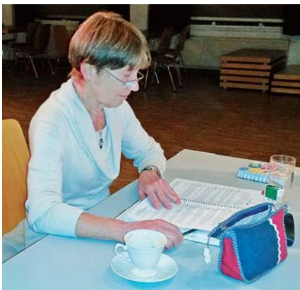
Für die Souffleuse gab's viel zu tun ...