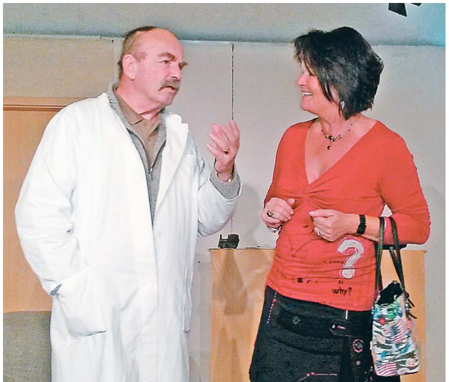
»Ja, Frau Bürgermeisterin ...« (Probenfoto)