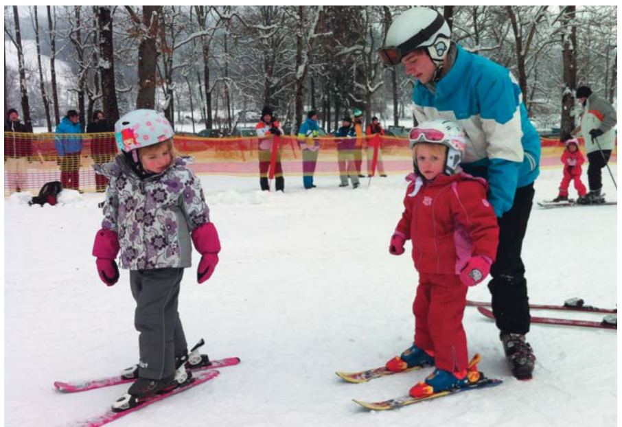
... und in der heutigen Zeit.