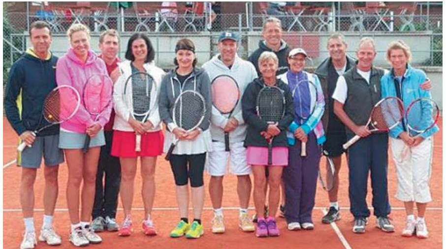
Die Sieger und Platzierten des Mixed-Clubturniers

Die Sommersaison ging rasend schnell vorbei, so dass wir am 10. Oktober zu unserem