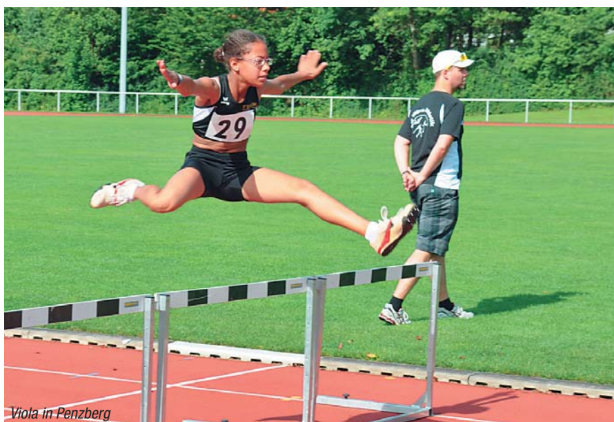
Viola in Penzberg