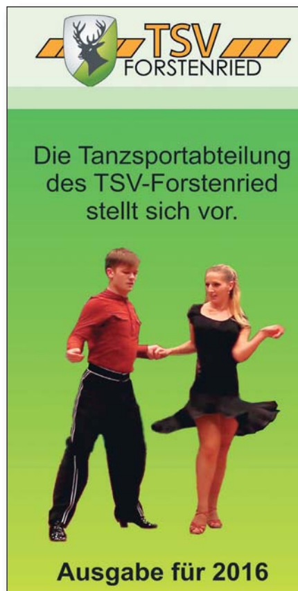
Unser Flyer in der Ausgabe für 2016