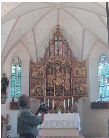
Kirche in Mörlbach