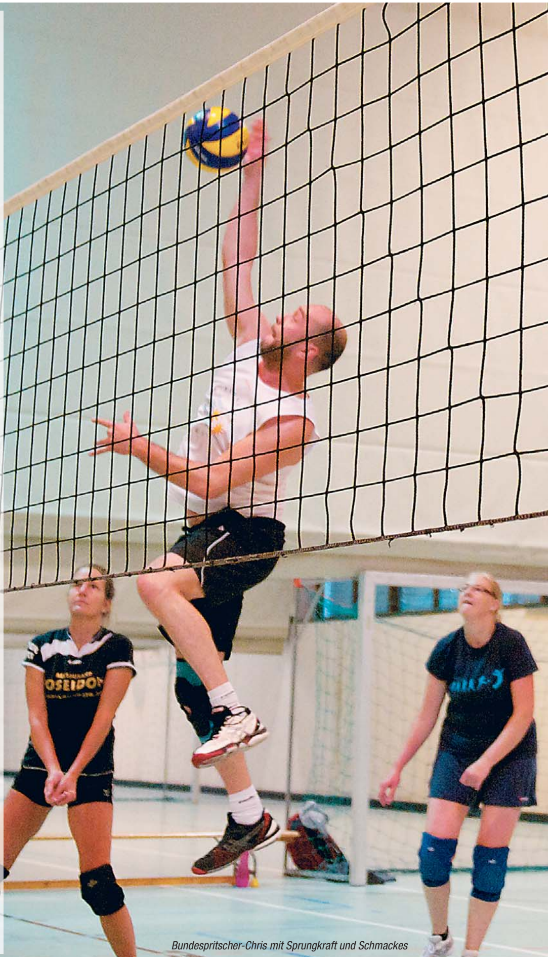
Bundespritscher-Chris mit Sprungkraft und Schmackes

Aber manchmal sah es auch anders aus, denn dann waren die Missverständnisse auf dem Feld mit Händen zu greifen. Ergebnis: Der Ball plumpste unbehelligt zu Boden. Um diesen Missstand zu beheben, suchen die Bundespritscher dringend lustige und technisch versierte Mitspieler. Immer freitags, 19 Uhr, südliche Auffahrtsallee.